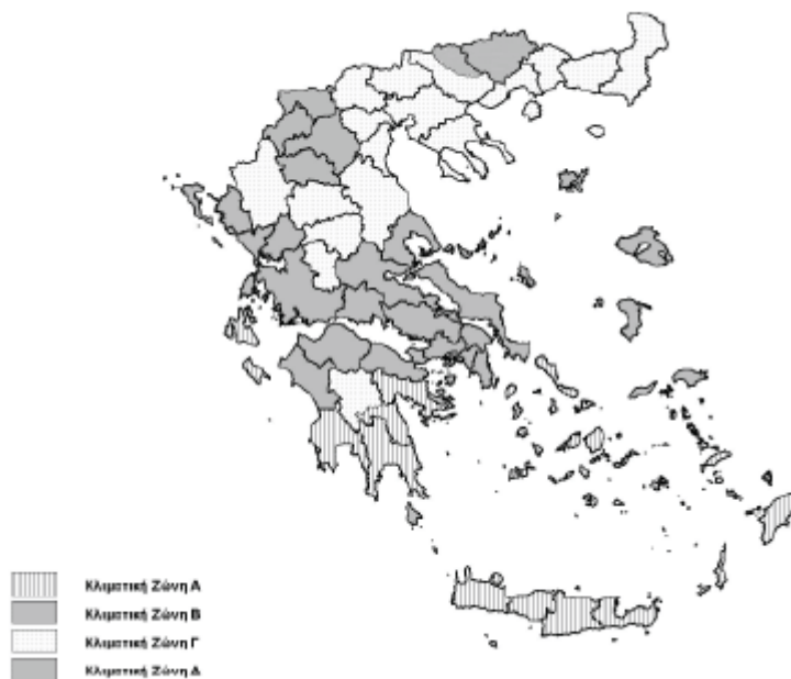
Σχήμα 1 Σχηματικά απεικόνιση κλιματικών ζωνών ελληνικής επικράτειας.